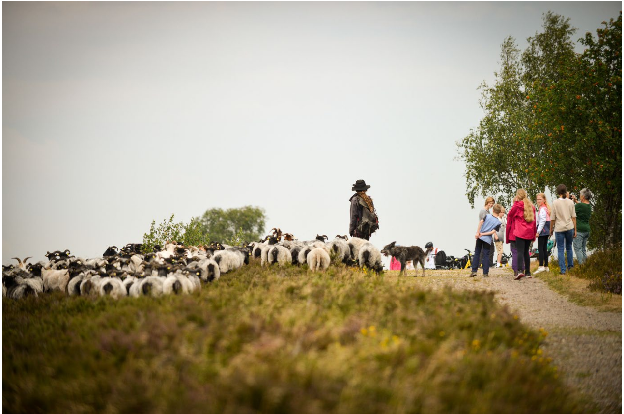
Gemeinsam den Naturpark und seine Besonderheiten erleben – beim Naturpark Elemente Sommercamp 2023.