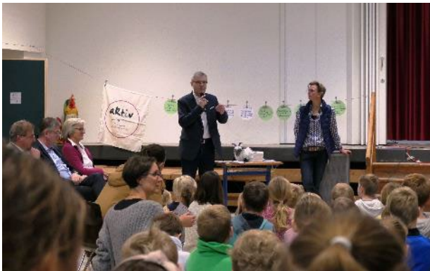
Zur ersten Monatsfeier der Schule seit Beginn der Corona-Pandemie gab es mit der Auszeichnung gleich einen feierlichen Anlass, sich mit der ganzen Schulgemeinschaft zu treffen.