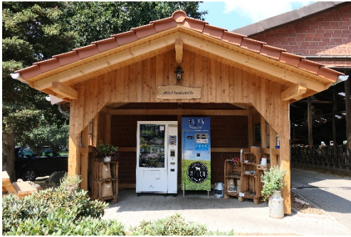
Regional und rund um die Uhr geöffnet: Das neue, EU-geförderte Verkaufshäuschen auf dem Hof Hankemeyer.