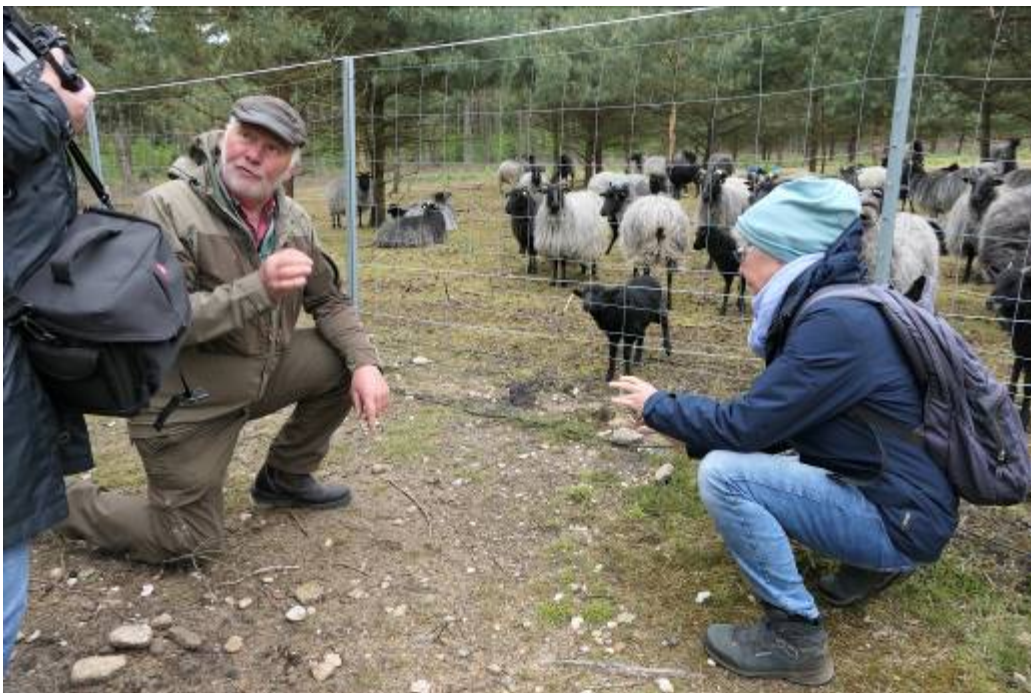
Schäfer von Hörsten erzählt den Lehrerinnen der Naturparkschule Sprötze-Trelde von der Lebensweise der Heidschnucken.