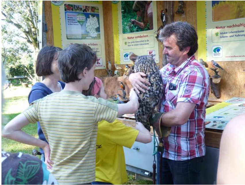
Foto: Uhu Ben freut sich auf viele kleine und große Besucher am 12. August 2013 bei der Ameisen-Erlebnis-Ausstellung in Döhle

Weitere Pressemitteilungen und Informationen zum Naturpark Lüneburger Heide finden Sie in unserem Pressebereich: http://www.naturpark-lueneburger-heide.de/subnavigation/pressebereich.html