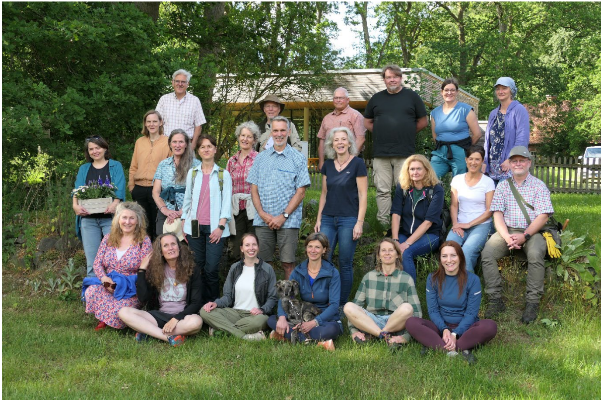
Gruppenbild nach der Prüfung

Naturpark Lüneburger Heide, seinen Aufgaben und Angeboten finden Sie auf der Internetseite www.naturpark-lueneburger-heide.de .