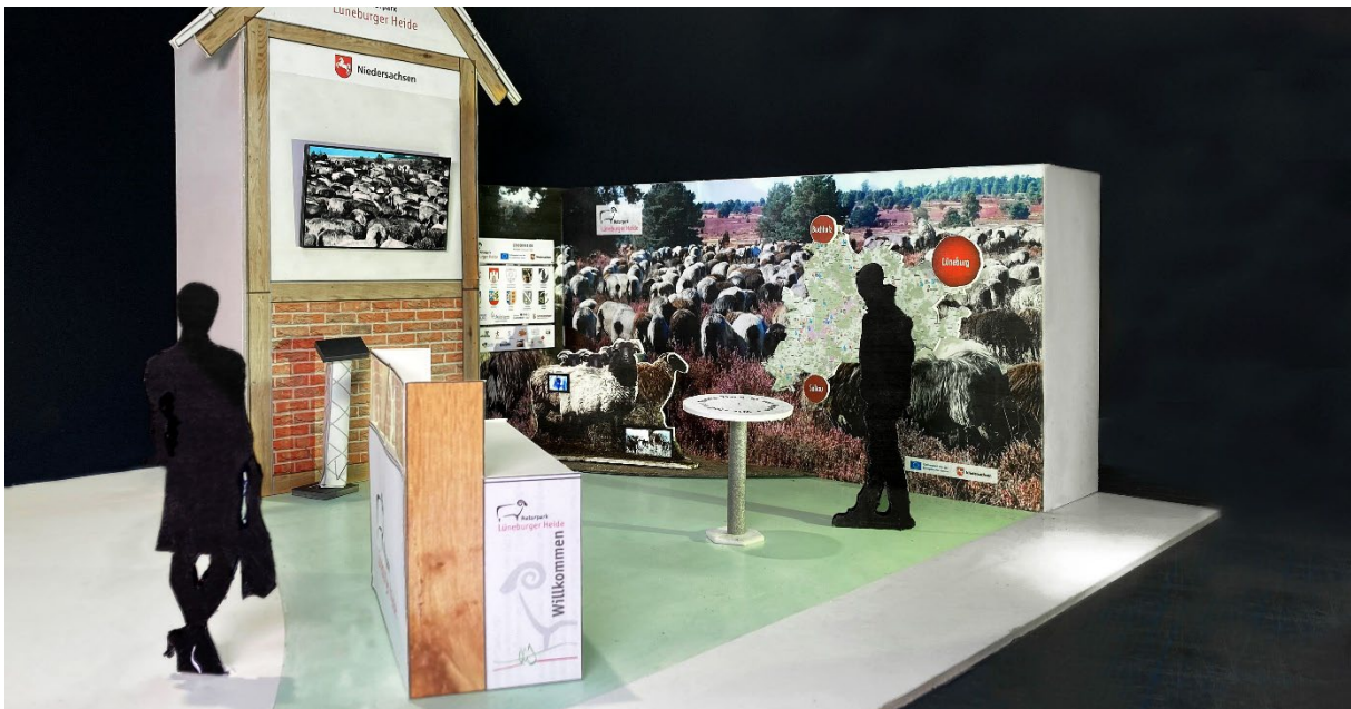
Foto: Modell des Naturparkstands auf der Internationalen Grünen Woche

Besuchen Sie uns am Stand 108 in der Niedersachsenhalle Nr. 20 und entdecken Sie die Vielfalt der Naturparkregion Lüneburger Heide!