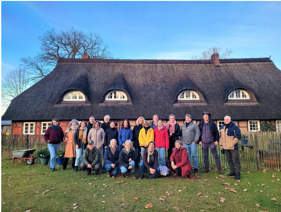
Engagiert und motiviert: Der neue Ausbildungsjahrgang der Zertifizierten Natur- und Landschaftsführenden beim Auftaktwochenende.