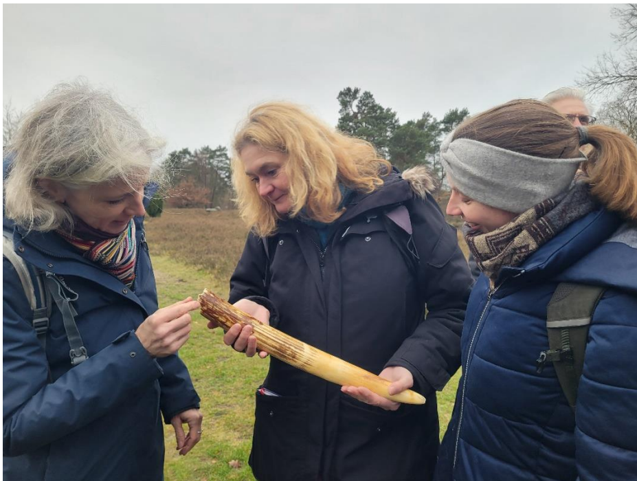
Kursteilnehmende begutachten einen Mammutzahn - ein eindrucksvolles Relikt aus der eiszeitlich geprägten Landschaft, die die Lüneburger Heide bis heute formt.