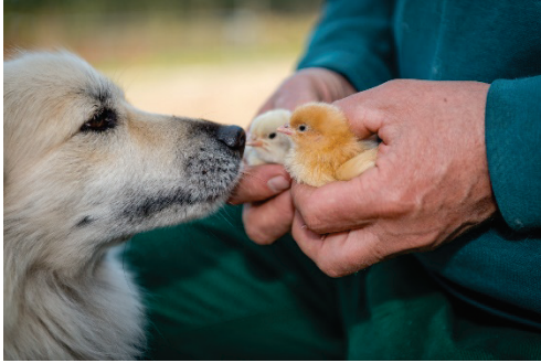
Küken in der Biobaumschule von Elling in Asendorf: Die Szenerie hat etwas Beschützendes.