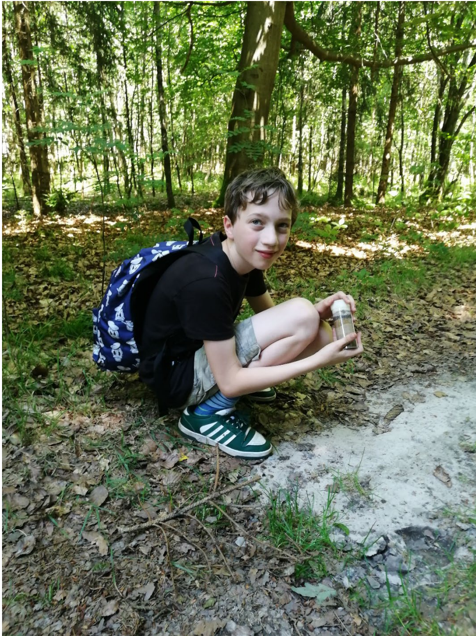
Ein Teilnehmer zeigt ein Bodenprofil im Glas