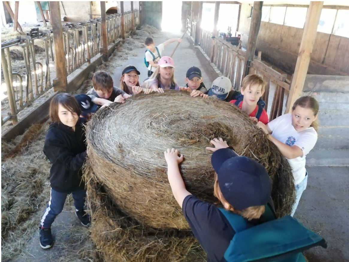
Bei einem Ausflug zum Bio-Bauernhof durften die Kinder mit anpacken