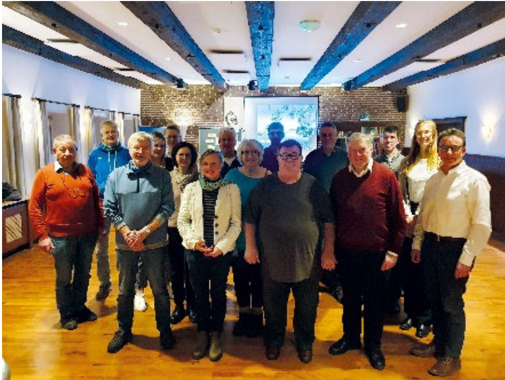
Teilnehmende des Runden Tisches, die das Kanuwandern auf der Luhe naturverträglicher gestalten wollen.