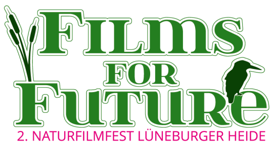
Bildunterschrift: Logo des Naturfilmfestes Lüneburger Heide