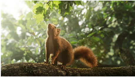
Bildunterschrift: Film-Still aus dem Film „Die Eiche mein Zuhause“, zweimal im Programm des Naturfilmfestes.