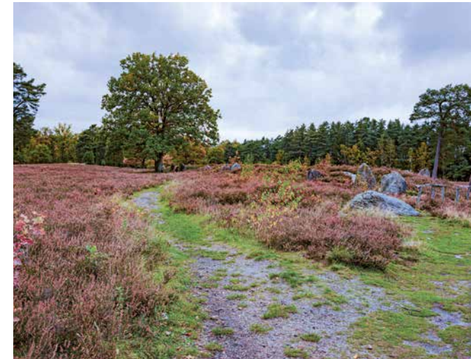
Die historischen Gräber der Oldendorfer Totenstatt sind in eine Heidefläche eingebettet.

Trotz dieser Thematik: Die Oldendorfer Totenstatt hat nichts Morbides. Die Gräber liegen in einer idyllischen Heidefläche, die zu einem Spaziergang einlädt, umrahmt von Wald. Und gerade die Natursteine der Gräber sind es, die den Blick darüber hinaus auf eine ganz besondere Spezies der Natur lenken: Flechten.