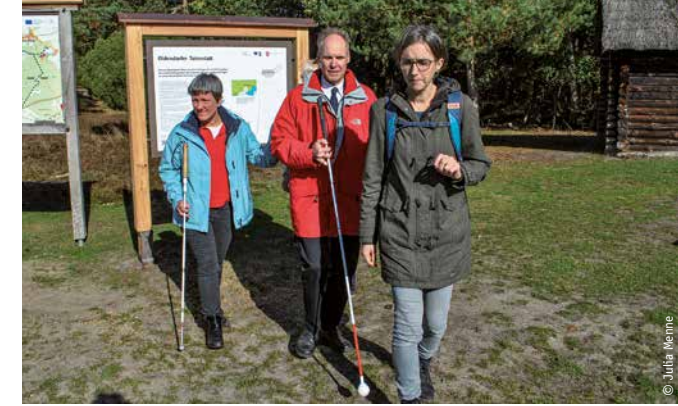
Menschen mit Sehbehinderungen testen das Angebot bei der Einweihung der Schilder.