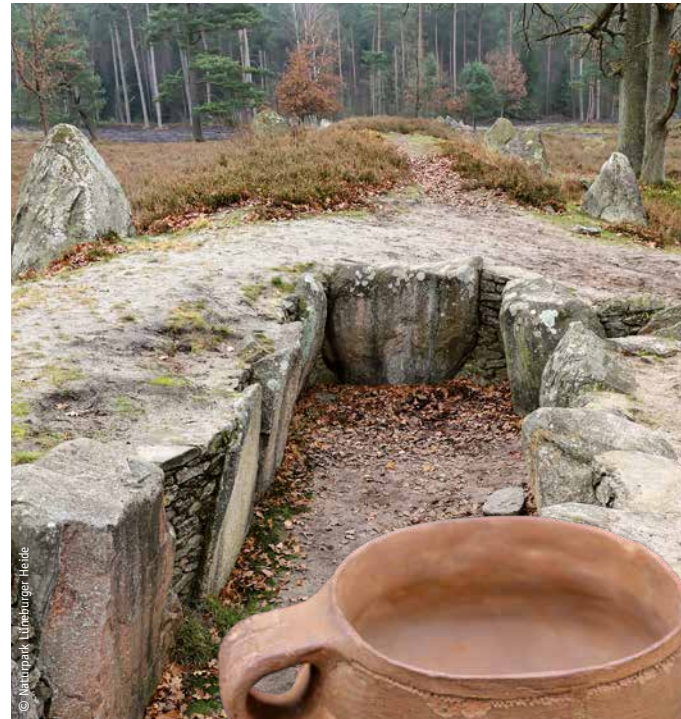
Blick in eines der urchichtlichen Gräber (oben). Foto rechts: Exponat aus dem Archäologischen Museum.

Für die Oldendorfer Totenstatt haben die Analyst:innen für die Zeit um 3900 v. Chr. die bäuerliche Lebensweise bestätigt gefunden. Sie wiesen durch die Pollen flächenhafte Eingriffe in die Natur nach. Rund 1.000 Jahre später ließ sich für das Umfeld von Siedlungen eine allmähliche Auslichtung der Wälder zeigen – eine halboffene Landschaft. Beides sind starke Indizien für eine Lebensweise mit Ackerbau und Viehhaltung.