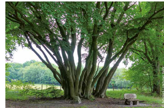
Die imposante Stammesvielfalt der Stühhüsch stammt aus einem einzigen Wurzelstock. Das Bild zeigt das Naturdenkmal 56 „Vielstammige Buche“ im Höpen.

Das Camp Reinsehlen mit seiner großen Magerrasenfläche hat eine wechselvolle Geschichte hinter sich (großes Foto).