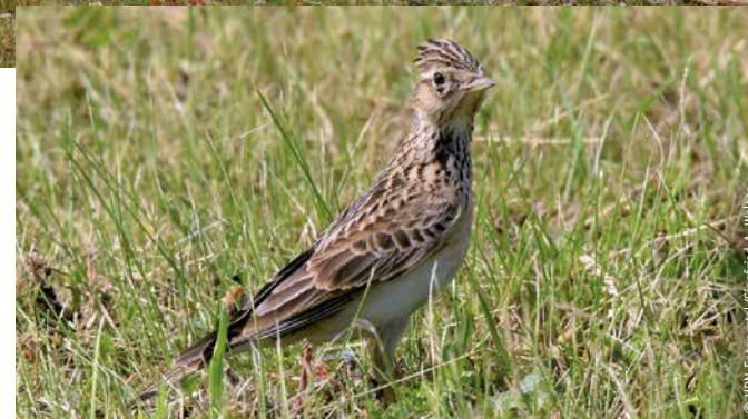
Die Feldlerche benötigt für ihre Brut offene Landschaften.