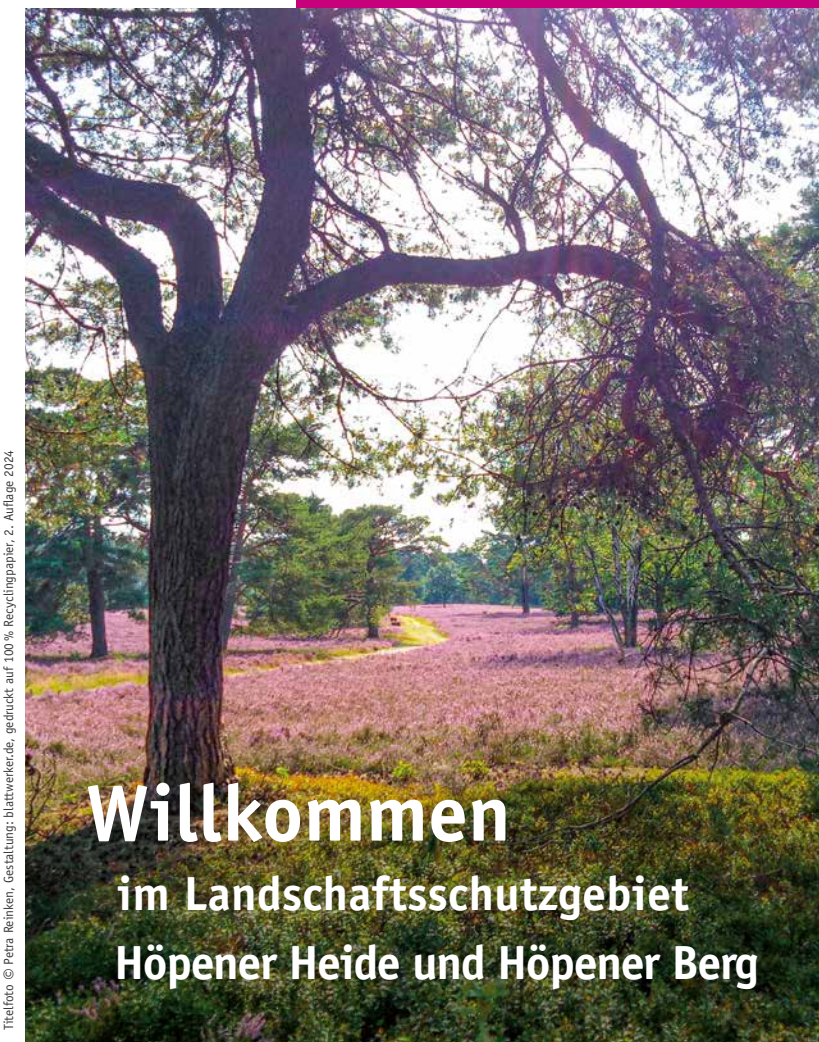
Gestaltung: blattwerke.de, gedruckt auf 100 % Recyclingpapier 2. Auflage 2024.

Willkommen im Landschaftsschutzgebiet Höpener Heide und Höpener Berg